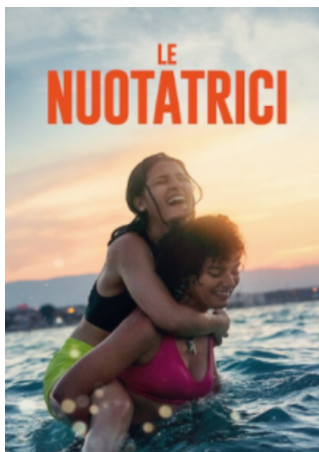
La locandina del film Le nuotatrici

Il 18 Dicembre, anche il nostro istituto, ha celebrato la giornata mondiale del migrante. Ancora tante, troppe, le persone che lasciano la loro terra natale perché costrette da motivi sempre più gravi come guerre o catastrofi naturali. E quando le persone non hanno più un posto fisso dove stare non può che essere un diritto orientare la propria vita verso la salvezza. I film ci aiutano da vicino a comprendere questa problematica. Una tra le pellicole che suggeriamo è Le nuotatrici , film tratto dalla vera storia di Yusra e Sarah, due piccole sorelle siriane con un grande sogno, quello di partecipare alle olimpiadi di nuoto di Rio. A sconvolgere i loro piani la guerra in Siria e la necessità di superare un muro d'acqua, il Mediterraneo. Non sanno, però, che sarà proprio lo sport a permettere loro di superare qualsiasi ostacolo.